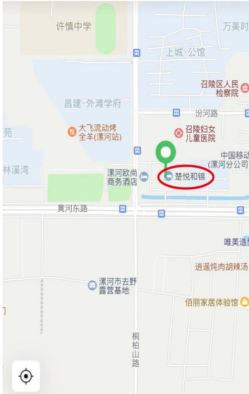
楚悦和锦酒店地址