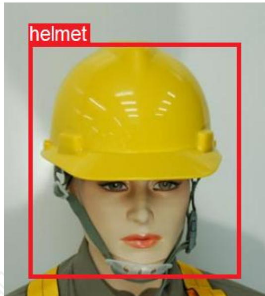
图 4：安全帽佩戴检测示意图