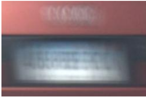
图 1：模糊图片示意图

读取所需数据集后，去除无法加载的异常图像、模糊图片、相似图片、删除单通道图像等。